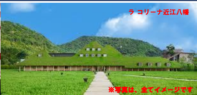
ラ コリーナ近江八幡